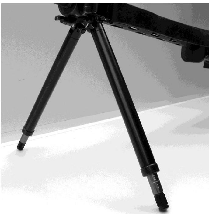
Figura 8: Bipiede regolabile per F ass 57 diversi modelli