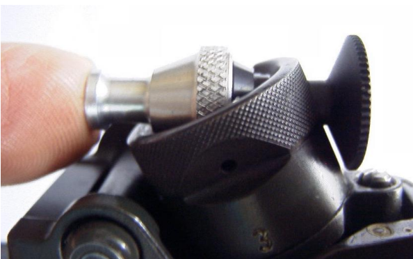
Figura 5: Sistema di filtri colorati Wyss innestabile