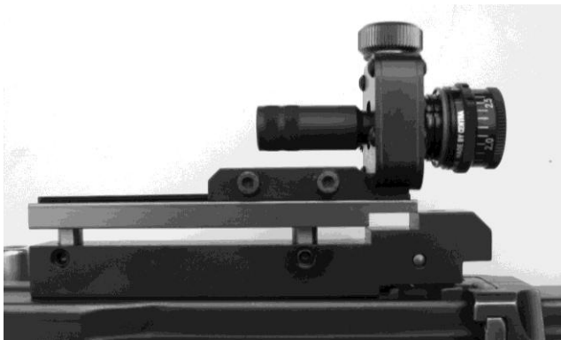
Figura 12: Supporto dell'alzo per il F ass 57 per il montaggio di comuni alzi circolari antiproiettili diversi modelli