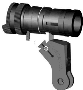
Figura 19: Portamirino universale per F ass 57 (montaggio normale) diversi modelli