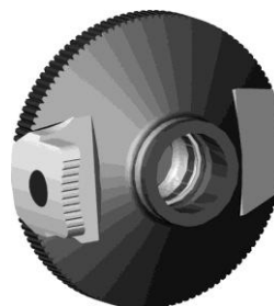
Figura 6: rondella per l'uso di filtri colorati su diaframma ad iride diversi modelli