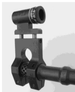
Figura 11: Portamirino come prolungamento della linea di mira (montaggio sul freno di bocca) diversi modelli