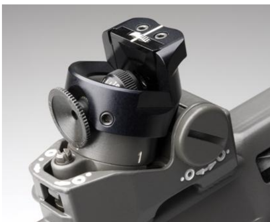
Figura 4: filtro colorato eccentrico con supporto girevole, modello Grünig + Elmiger; modello Wyss simile