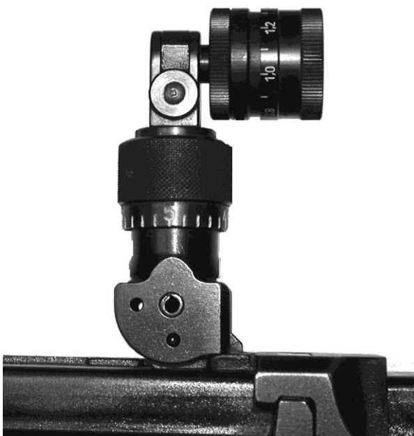
Figura 8: Diaframma ad iride per F ass 57 (con o senza filtri colorati o di polarizzazione) diversi modelli