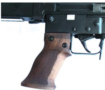
Figura 13: impugnatura a pistola Tactical per F ass 57 diversi modelli