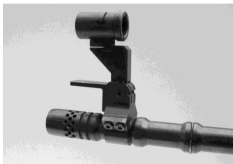
Figura 10: Portamirino come prolungamento della linea di mira (montaggio sulla canna) diversi modelli

Il montaggio del portamirino va effettuato obbligatoriamente dal fabbricante o dal commercio specializzato.