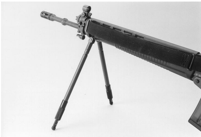
Figura 2: bipiede regolabile per fucile d'assalto 90 diversi modelli